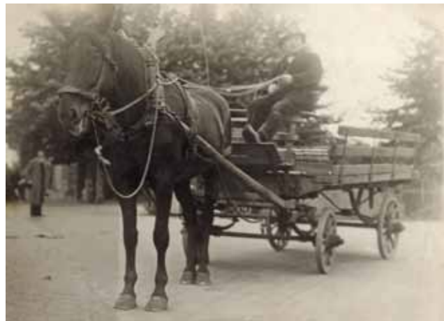
Twee archiefphoto's: Vervoer toentertijd per paard en later met de vrachtwagen.