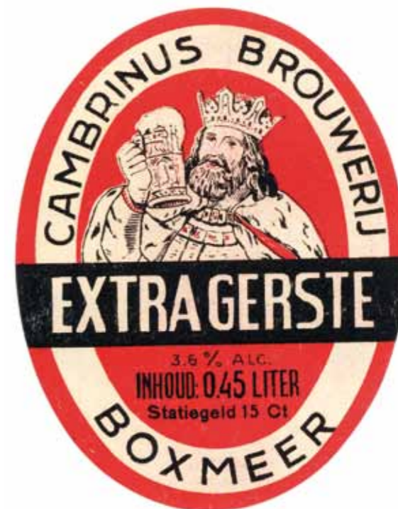
Biergod Cambrinus op een etiket van de Boxmeerse brouwerij.

In de oorlogsjaren bieden de kelders van Cambrinus onderdak als schuilplaats voor enkele tientallen buurtbewoners. Kort na de verplichte evacuatie