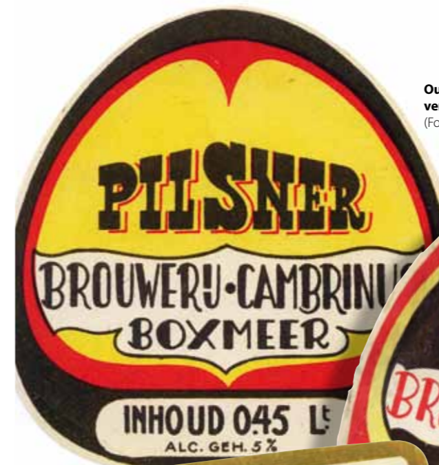
Oude etiketten van de verschillende bieren uit Boxmeer.